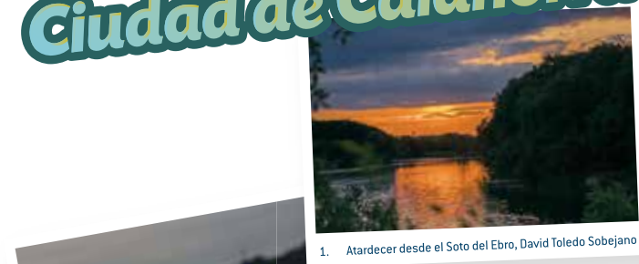
1. Atardecer desde el Soto del Ebro, David Toledo Sobejano