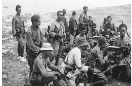
El desastre de Annual y su representación en Calahorra