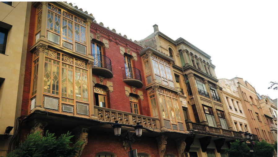
Casa de las Cariátides, Calahorra