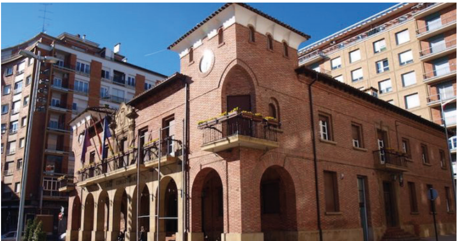
Casa Consistorial, Calahorra.

En 1945 se levanta la Casa Consistorial de Calahorra en uno de los puntos más céntricos de la ciudad, la glorieta Quintiliano. A un paso del casco histórico, junto al paseo del Mercadal y del centro de comercio y restauración de la localidad. Con un estilo arquitectónico muy llamativo, está revestido de ladrillo rojo por completo, al igual que sucede con las iglesias de la zona, y luce nueve arcos que dan cabida a un pequeño soportal. La plaza queda dominada por este edificio y la gran rotonda ajardinada donde luce el monumento a Quintiliano, orador romano nacido en Calahorra. También, a pocos metros podemos ver alta y esbelta la Picota, también llamada como Rollo Jurisdiccional.