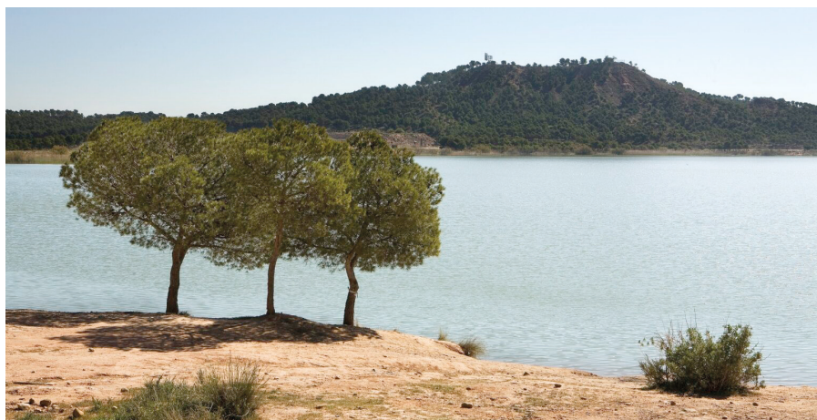
Estanca del Perdiguero, Calahorra

MORENO FERNÁNDEZ, J.R., Industria, agricultura y crecimiento económico: las conservas vegetales y el regadío en La Rioja durante el siglo XX , Logroño: Universidad.