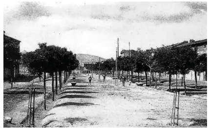
La Retina, vista antigua del Mercadal de Calahorra

Todo ello se hizo con la condición de preservar las imágenes de los santos Emeterio y Celedonio , que serían colocados en un lugar próximo. También se trazan los paseos del Siete y de las Rosas ( calles Mártires y Bebricio ). El final del siglo XIX coincide con la realización de una glorieta radial (actualmente frente al Ayuntamiento) y se comienza la urbanización de un boulevard sombreado, el paseo de Canalejas (actual Mercadal).