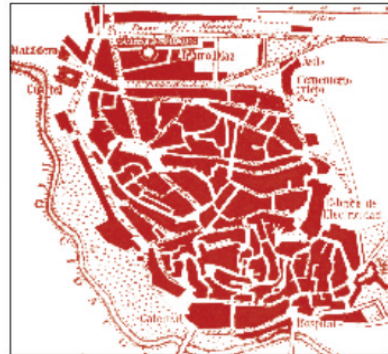
Plano de Calahorra en 1910.

En el año 1900 Calahorra tenía 9.475 habitantes y una estructura social basada en un reparto minifundista de la tierra en una ciudad en la que la agricultura era parte fundamental de su estructura económica. En este contexto cabe destacar que las dos primeras décadas de los años veinte en Calahorra serán decisivas para su crecimiento económico. Varios factores contribuirían decisivamente a ello, sobre todo la ampliación de la superficie regable con la construcción del pantano de la Estanca del Perdiguero en 1885 y la construcción del Canal de Lodosa .