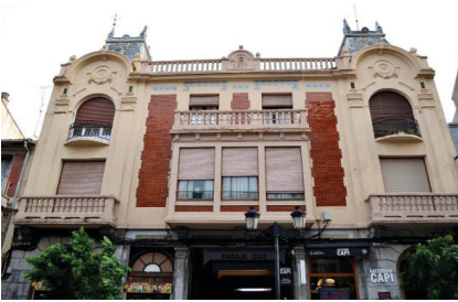
Casa Pasaje Díaz, Calahorra

Una vez derribada la Puerta Vieja , Calahorra comienza a expandirse extramuros, dando lugar a la calle Mártires. En la actualidad se conservan varios edificios singulares que reflejan el empuje de la burguesía empresarial conservera de los primeros años del siglo XX. Estas fachadas manifiestan las nuevas corrientes arquitectónicas de la época, destacando el eclecticismo de la Casa Pasaje Díaz , el neomodéjar en la Casa Baroja y el modernismo en la Casa de las Cariátides .