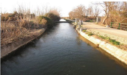
Canal de Lodosa, Calahorra.