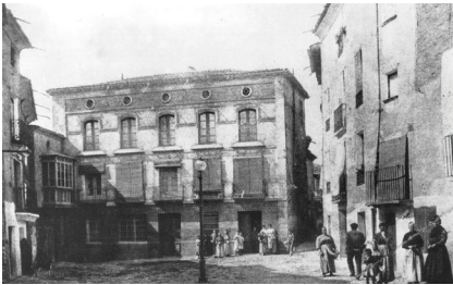
La Retina, plaza de la Verdura de Calahorra

Fue en 1863 cuando se acordó derribar el arco de la citada Puerta Vieja por quedar demasiado angosto el camino hacia los portales de la calle Grande.