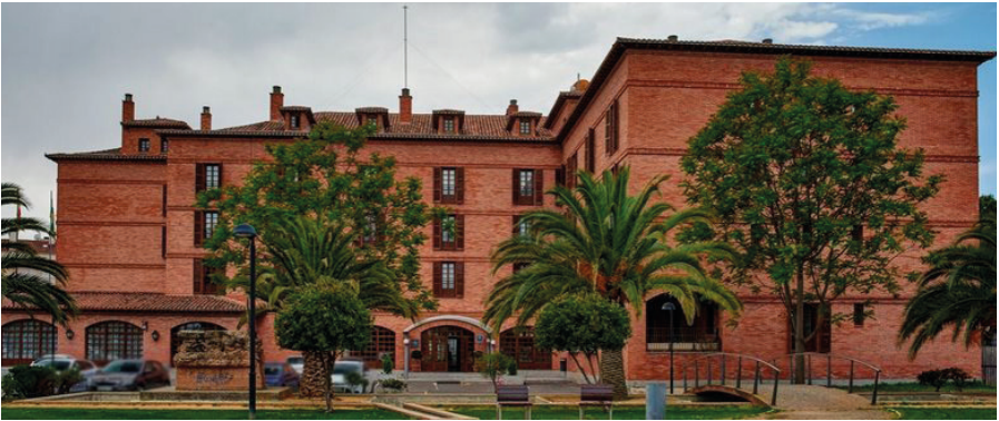
Parador Nacional de Turismo, Calahorra.

En la conmemoración del 18 de julio, tuvo lugar en 1975 la inauguración del Parador Nacional de Turismo . El acto fue un indiscutible acontecimiento social pero también político. A Calahorra llegó el ministro de Información y Turismo, León Herrera y Esteban , siendo recibido por las autoridades. La nueva infraestructura hotelera contaba con 67 habitaciones, comedores y salones sociales.