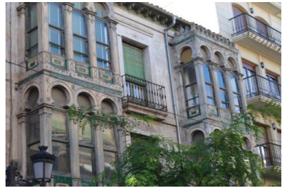
Casa Baroja, Calahorra