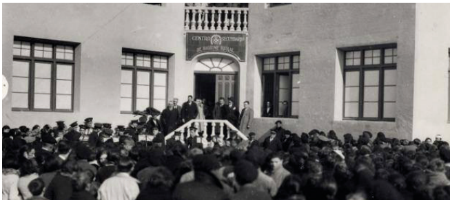
Centro de higiene de Calahorra