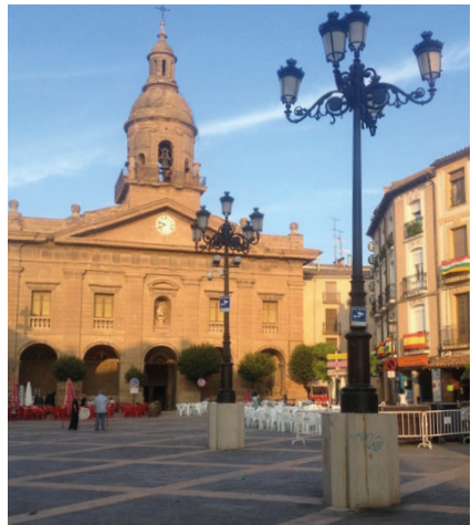
Plaza del Raso, Calahorra

La Catedral de Calahorra es la primera Sede Episcopal de la Diócesis de Calahorra y La Calzada-Logroño. Su situación en el arrabal a orillas del río Cidacos, extramuros de la ciudad, es una ubicación atípica pero no casual. Su origen se remonta al siglo IV, en el que se erigió un templo martirial ( Martyrium ) donde se veneraban las reliquias de los Santos Mártires Emeterio y Celedonio , y un Baptisterio paleocristiano construido en el mismo lugar donde los dos jóvenes soldados fueron martirizados.