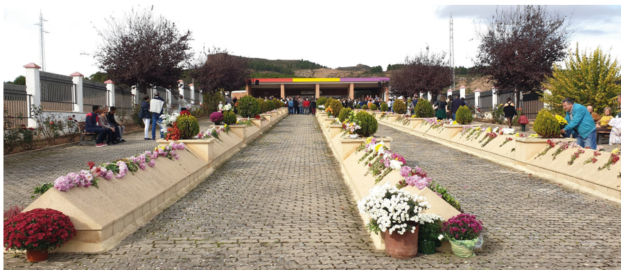
Memorial de la Barranca, en Lardero

La Rioja fue un territorio conquistado por los insurrectos desde el primer día. La provincia de Logroño estaba lejos del frente, sus habitantes de derecho ascendían en 1930 a 207.262.234. Hoy sabemos que con seguridad fueron asesinadas un mínimo de 2.000 personas . Uno de los municipios más castigados por la dura represión fue Calahorra. En esta ciudad la indicación del General Mola de que la "acción ha de ser en extremo violenta" se cumplió sin titubeos. Si en Logroño fueron asesinadas 240 personas de una población de 34.329, en Calahorra fueron asesinadas al menos 214 personas en una ciudad de algo más de 12.000 habitantes . En La Rioja, los primeros meses registraron el mayor índice de ejecuciones. De los 1.713 ejecutados en 1936, el mes más cruento fue agosto con 590 muertos y le sigue septiembre con 477, aunque durante el mes de julio, tras el golpe perpetrado el 18, fueron fusiladas otras 222 personas. Además de este elevado número de personas ejecutadas sumariamente, sin juicio alguno, hay que sumar las múltiples vejaciones, expedientes de supuestas responsabilidades civiles y políticas abiertas a personas en razón de su ideología política.