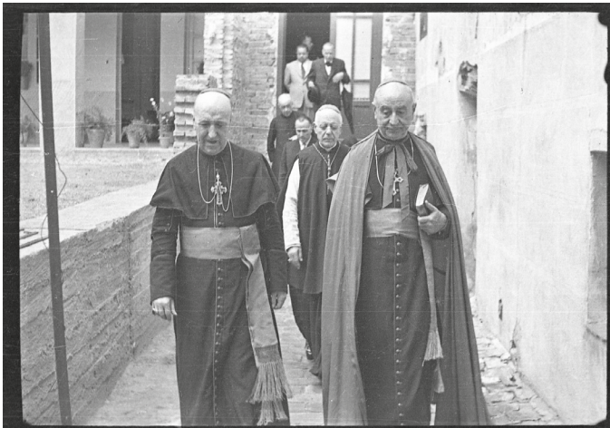
Obispo Fidel Garcia

La Dictadura de Primo de Rivera pone fin al conflicto de la sede episcopal que había quedado vacante al producirse el "motín" con el que había finalizado el siglo XIX. El nuevo alcalde nombrado fue Ricardo Palacio , que presidiría un ayuntamiento de mayoría derechista con un concejo integrado por una mayoría de la burguesía y del poder económico local y una representación mucho más exigua del sector primario que, a buen seguro, no eran de la mayoría minifundista de la agricultura calagurritana. Los elegidos pertenecían a las clases sociales que con tanto alborozo habían acogido el golpe militar de Miguel Primo de Rivera, al que hay que sumar el de la propia Iglesia que vio la llegada del general como una oportunidad "para la regeneración de la patria".