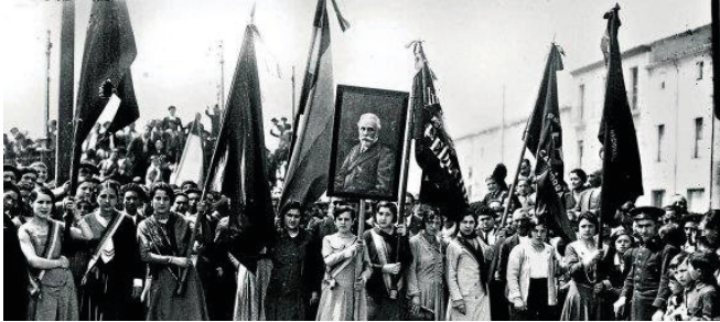
Calahorra celebrando la proclamación de la II República 57