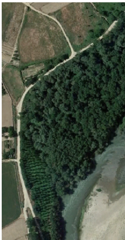
Choperita que se mete en el parche del Soto Los Majuelos (linde B)