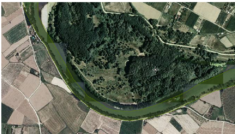
Franja de Vegetación de Ribera en Los Pontigones, dentro de la Red Natura (marcado por el sombreado verde)