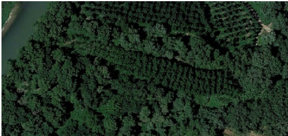
Cara norte del mayor de los muchos parches de La Cocha; se ve una Choperita en medio (linde B)