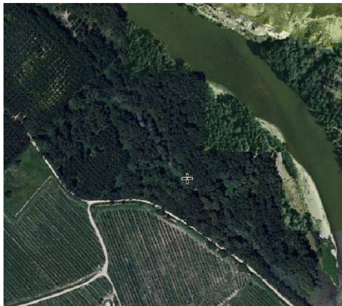
Soto Resa, fuera de la Red Natura

Las cuatro fotografías aéreas que siguen, muestran lo dicho; Sotos fuera de la Red Natura y Choperas y Franjas de Vegetación de Ribera, dentro.