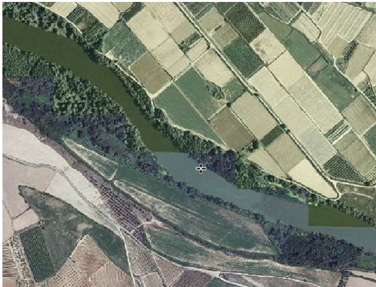
Los dos parches de Soto de El Cascajo, fuera de la Red Natura