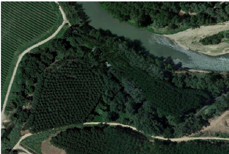
Bocario, desembocadura del río Cidacos en el Ebro. Entre las dos Choperas pasa el cauce del Cidacos, desembocando a la derecha de la foto (linde B)