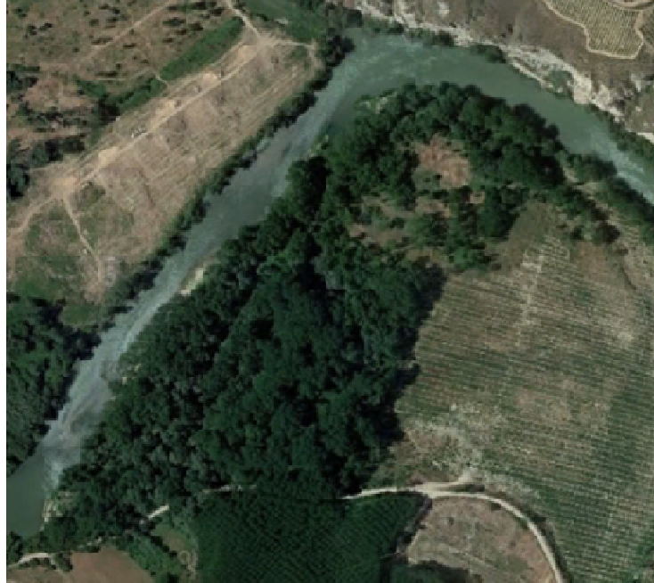
Uno de los dos parches del Soto de El Roturo; linda con el río y con una Chopera muy joven (linde A)