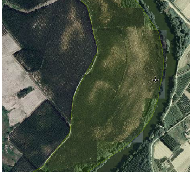
Chopera de La Rota, dentro de la Red Natura (marcado por el sombreado verde)

Esta situación se repite en todo la ribera riojana del tramo medio del Ebro, no así en la del tramo alto, pese a que este último no reúne las condiciones ecológicas que reúne el tramo medio, para la implantación de Sotos.