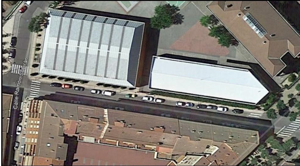
Figura 1: Avenida de Los Ángeles, tramo comprendido entre Subirán y Valvanera (pueden verse coches aparcados a ambos lados)

tramo entre Avenida de Valvanera y Ramón Subirán, provoca que cuando se cruzan dos vehículos el tráfico sea francamente difícil (Figura 1)